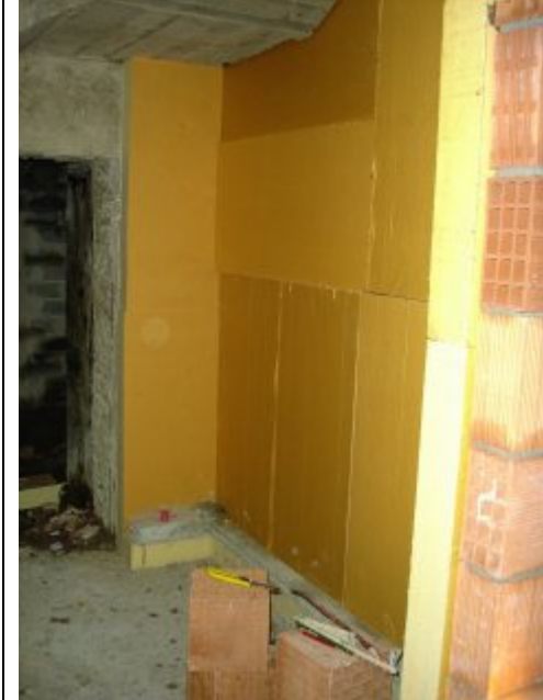
Isolamento parete perimetrale con Stiferite GT