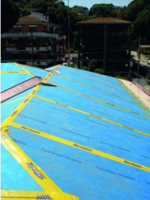
Isolamento copertura in legno con Stiferite Isoventilato