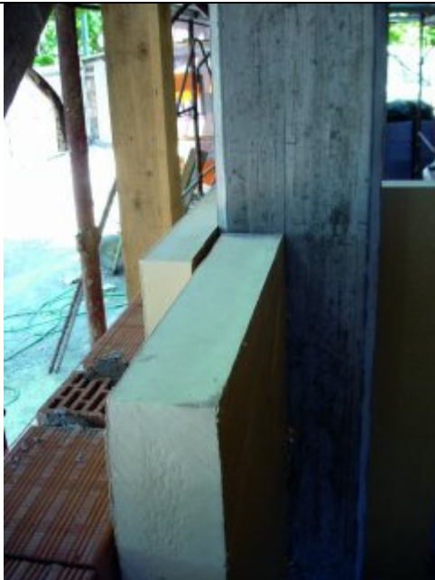
Correzione porte termico con Stiferite GT