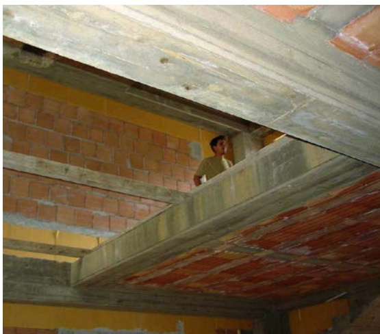
Isolamento interpiano con Stiferite GTE