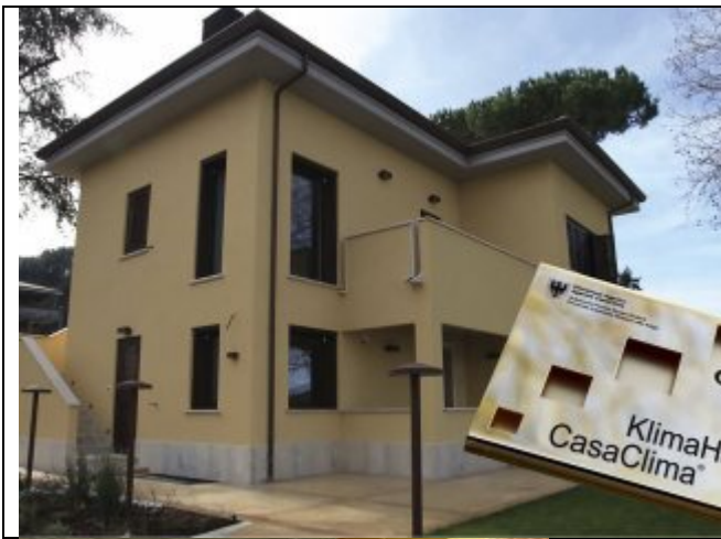
Esterno Villino Brenca ad Anguillara Sabazia (RM)