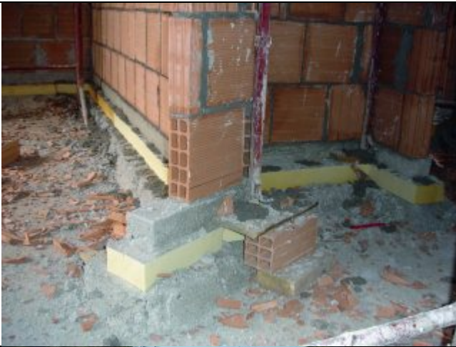
Isolamento solaio con Stiferite GTE